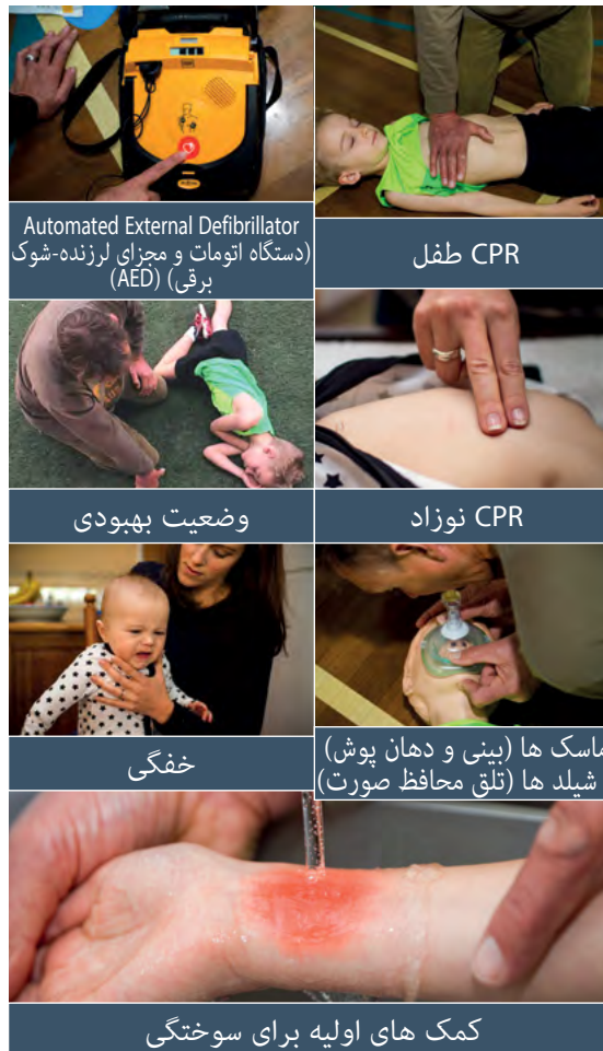
Automated External Defibrillator (دستگاه اتومات و مجرای لرزنده-شوگ برقی) (AED)

واحد های آموزشی موجود در این پروگرام آموزشی به شمول موارد زیر می باشد: