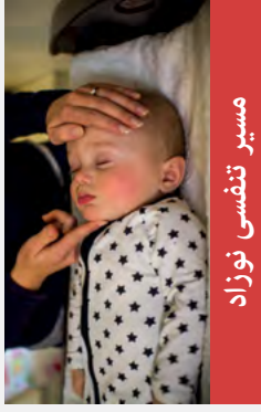
مسیر تنفسی نوزاد

سر را به طرف عقب متمایل کنید و زنج را بالا نگه دارید.