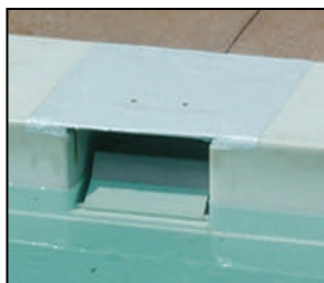
安全改良的撇垢水槽